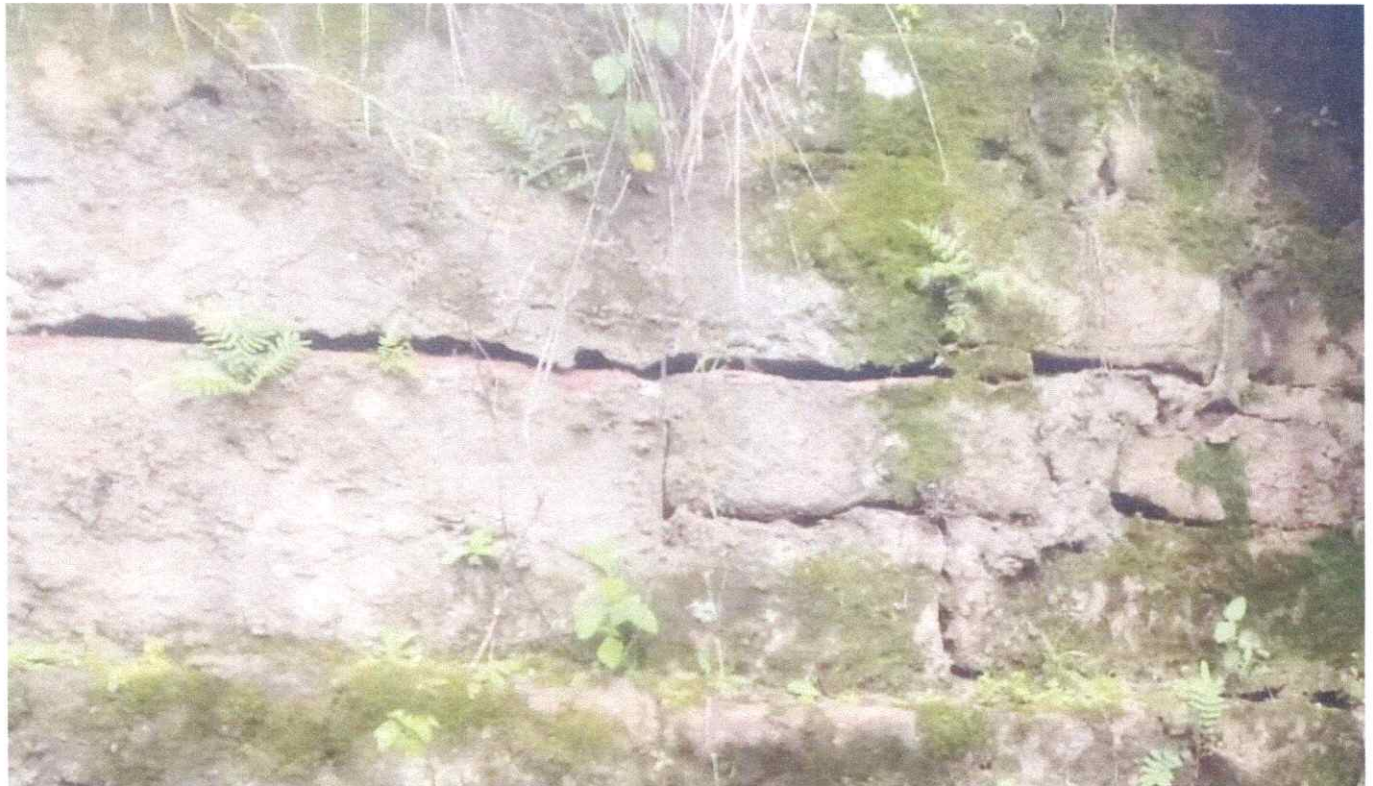
Figura 3 – Fissuras horizontais no elemento estrutural