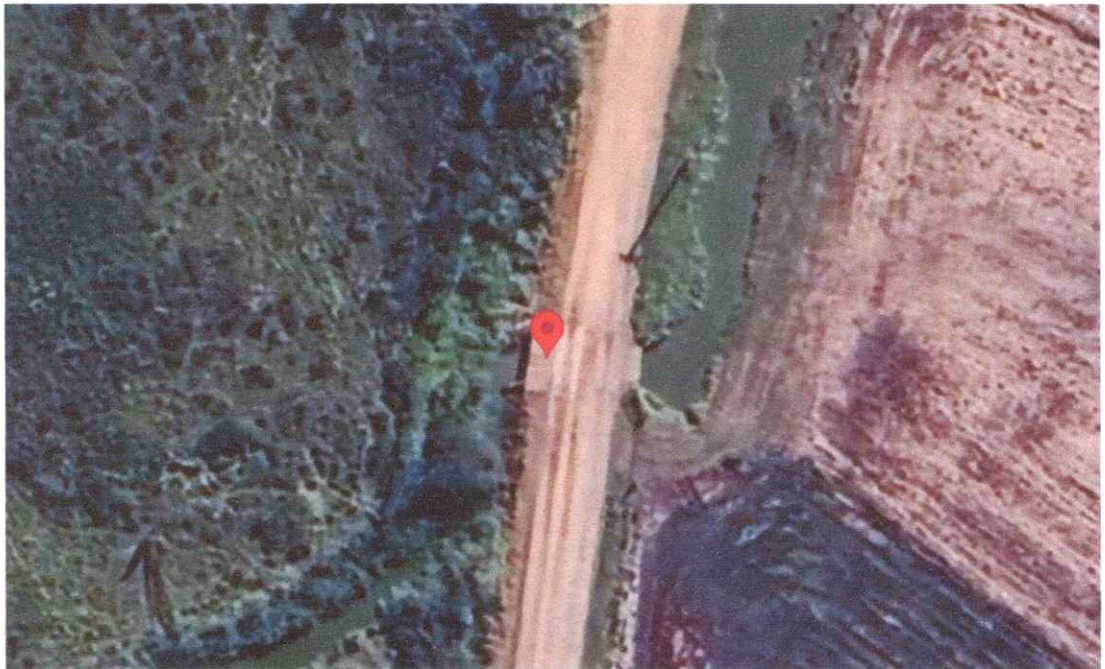
Figura 1 – Localização da Ponte

O presente laudo técnico tem como objetivo descrever as condições inadequadas da ponte da estrada Vereador Antônio Rodrigues, localizada próxima ao arrozal, com coordenadas 29^{\circ}45'46.0''S 51^{\circ}12'59.3''W conforme Figura 1, e recomendar a interdição imediata devido a deformações severas na estrutura de concreto armado.