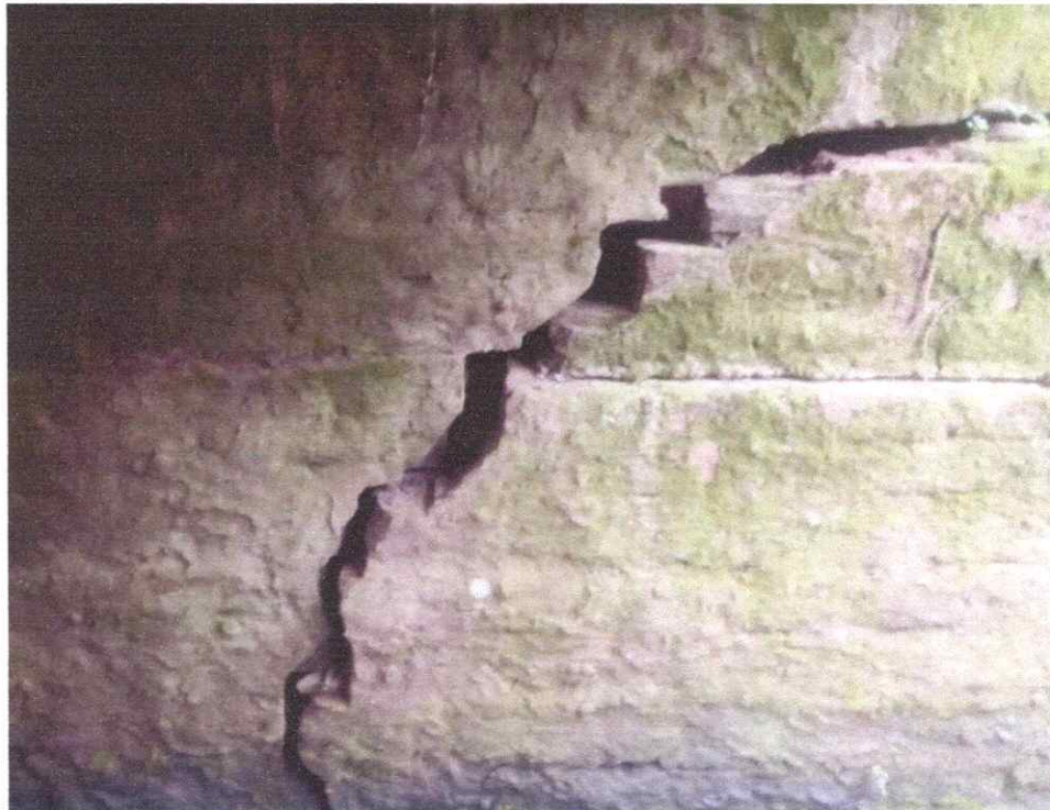
Figura 2 – Fissuras à 45° no elemento estrutural