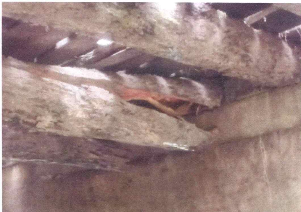
Figura 4 – Deformação do elemento estrutural de madeira devido a sobrecarga

A ponte apresenta deformações severas na estrutura, com risco iminente de colapso. Portanto, é imperativo que a mesma seja interditada imediatamente para evitar qualquer acidente grave. Recomendamos que medidas adequadas sejam tomadas para garantir a segurança pública e a restauração adequada da ponte.